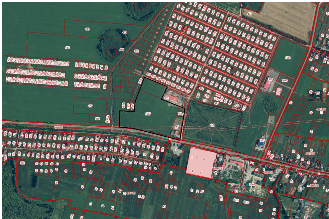
Схема границ территории документации по планировке территории (проект планировки и проект межевания) в районе улицы Ленина и переулка Парковый в селе Доброе Добровского муниципального округа