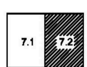
СХЕМА КОМПОЗИЦИИ ЛИСТОВ

ПРИМЕЧАНИЕ: Данный чертеж рассматривать совместно с чертежом 02/2016 - ПП, лист 7.1.